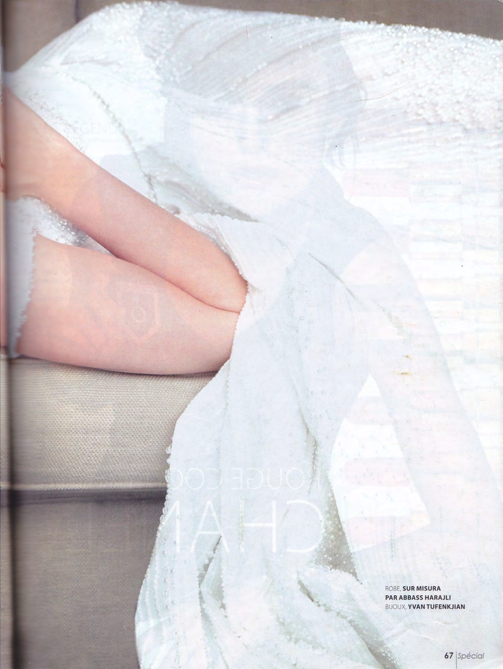
ROBE, SUR MISURA PAR ABBASS HARAJLI BIJOUX, YVAN TUFENKJIAN