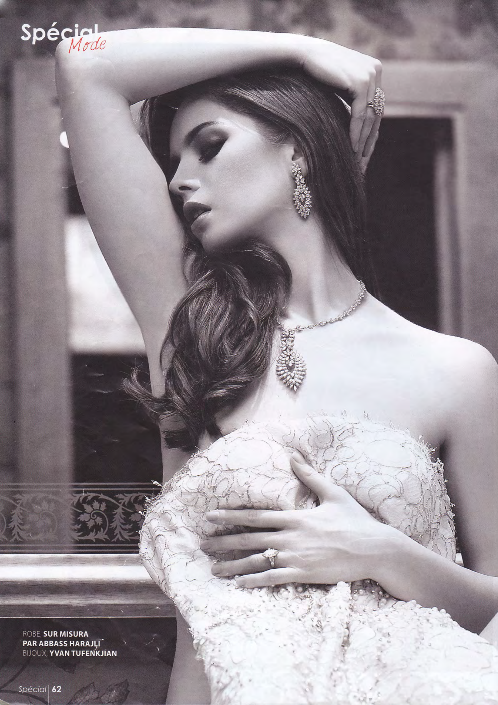
ROBE, SUR MISURA PAR ABBASS HARAJLI BIJOUX, YVAN TUFENKJIAN