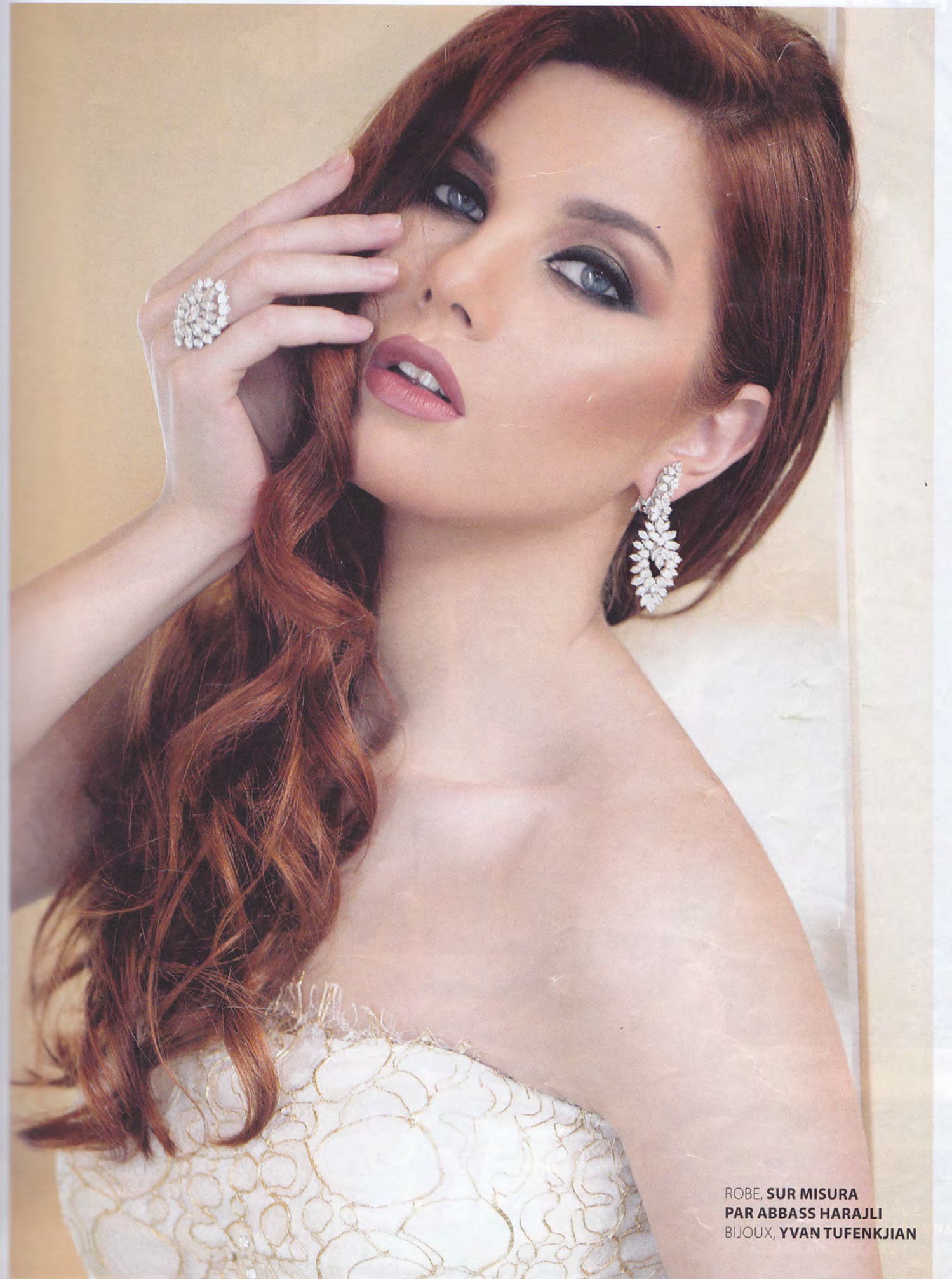
ROBE, SUR MISURA PAR ABBASS HARAJLI BIJOUX, YVAN TUFENKJIAN