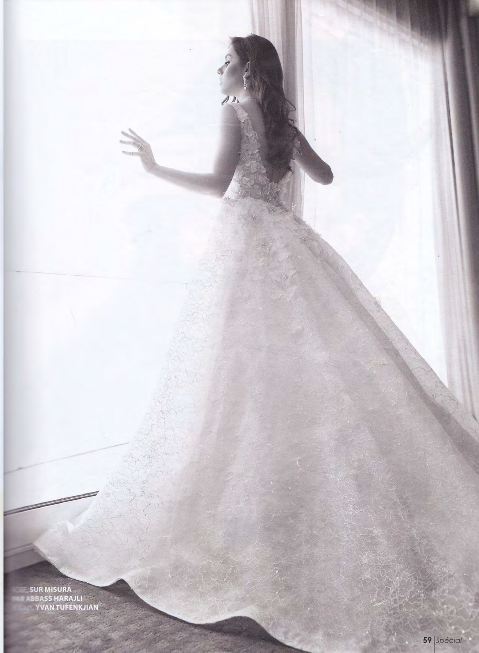
ROBE, SUR MISURA PAR ABBASS HARAJLI BIJOUX, YVAN TUFENKJIAN