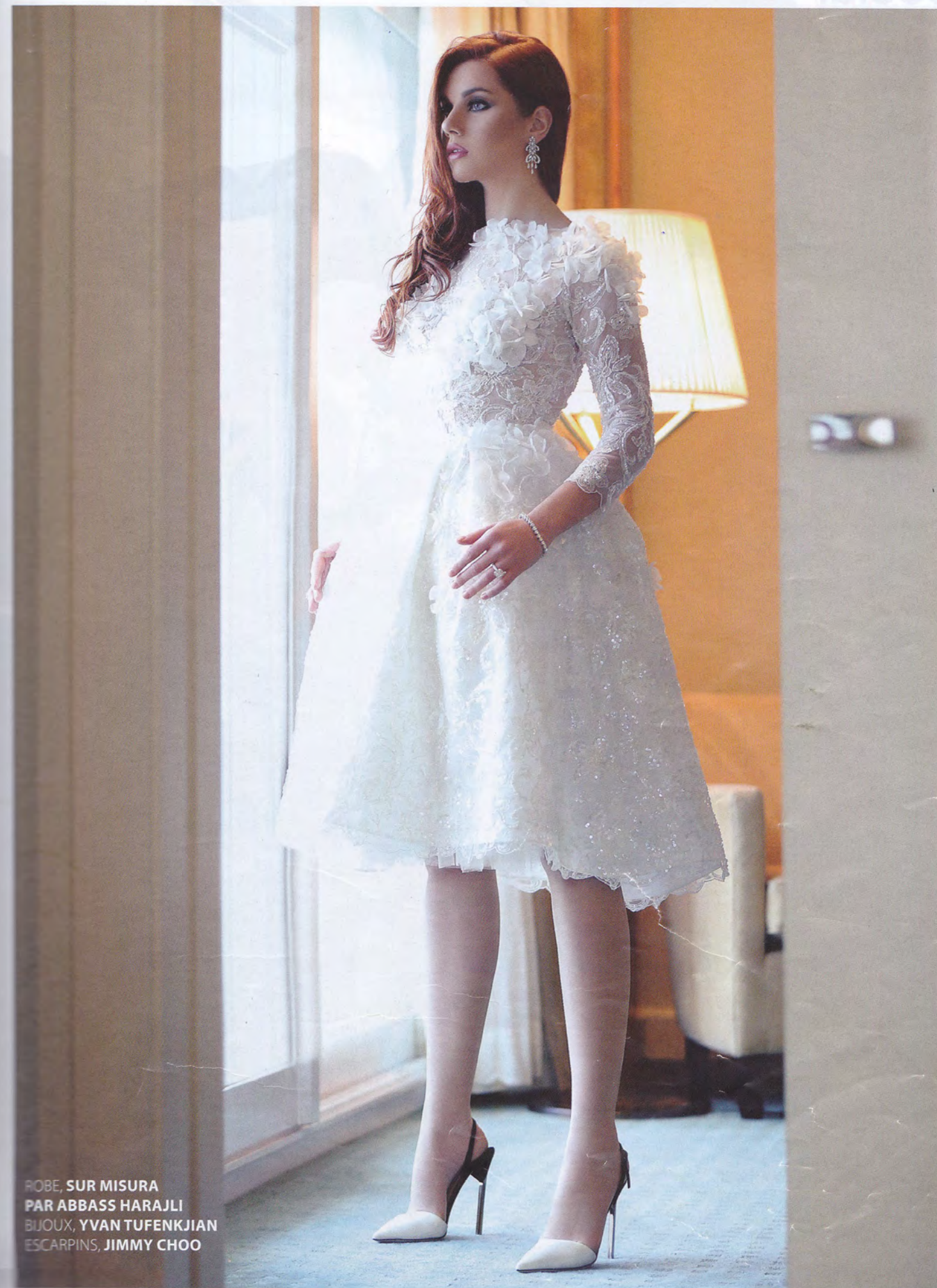
ROBE, SUR MISURA PAR ABBASS HARAJLI BIJOUX, YVAN TUFENKJIAN ESCARPINS, JIMMY CHOO