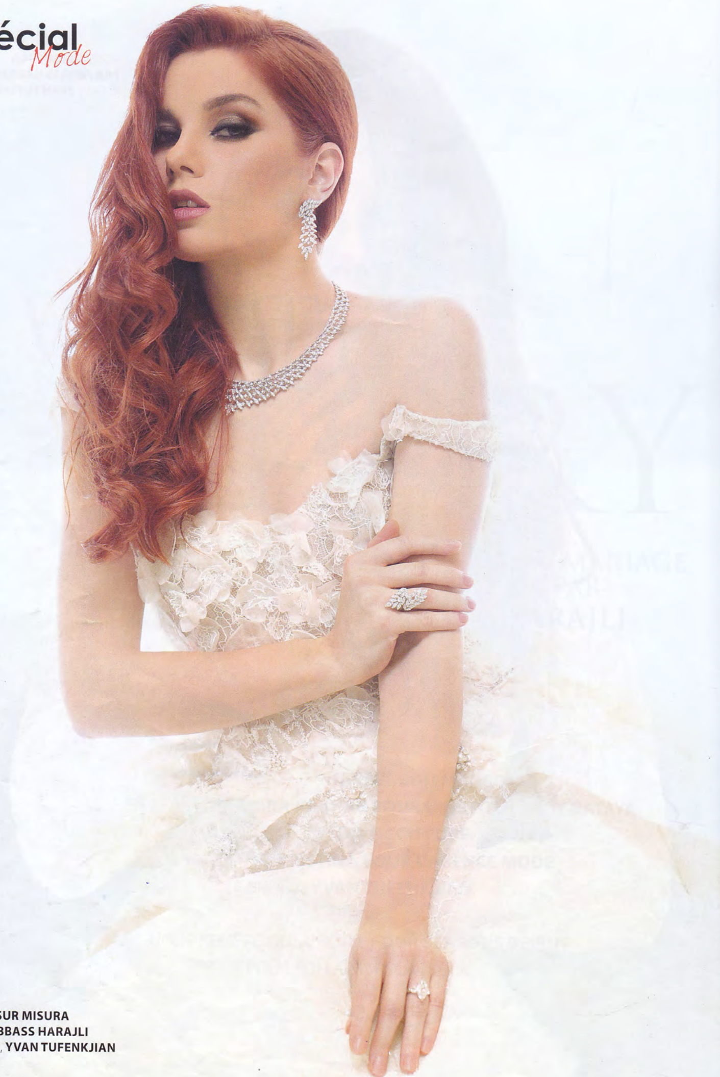
ROBE, SUR MISURA PAR ABBASS HARAJLI BIJOUX, YVAN TUFENKJIAN